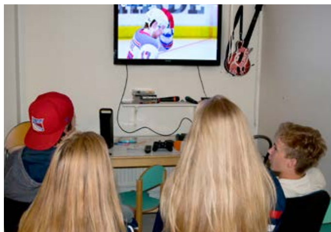
Att bara hänga med kompisarna utan krav har många undersökningar visat är vad ungdomarna önskar mest.

I ett gult hus i Dickursby finns Helsinggård, HG, som på fredagar välkomnar alla barn och ungdomar som talar svenska i Vanda. Endast ett stenkast från Dixi och med bra förbindelser till övriga Vanda och huvudstadsregionen gör att HG är ett naturligt ställe för barn och ungdomar att träffas och umgås med sina vänner.